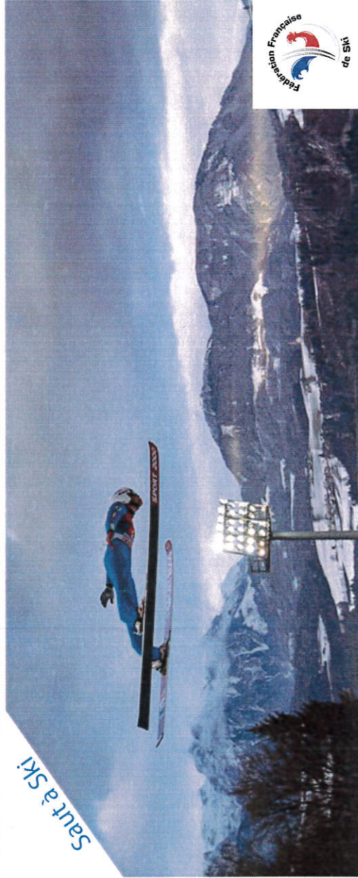
Saut à Ski