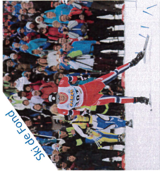
Ski de Fond